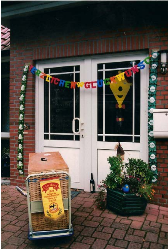
2x Deutscher Meister, Nachbarsgeschenk. Das wird teuer!